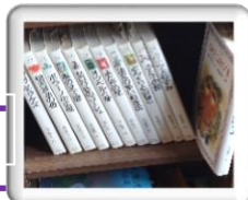
宮沢賢治の童話が読めます